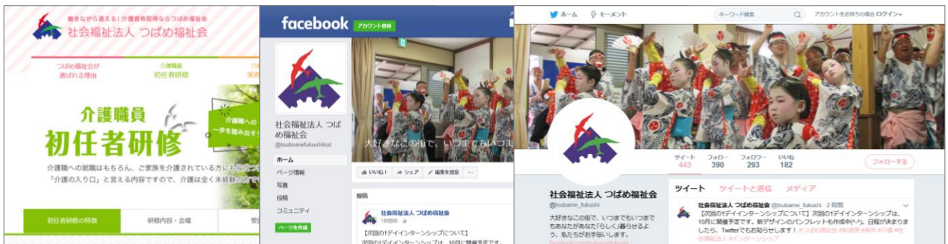
■ 研修ホームページ

～ 研修ホームページ公開！ facebookページ、Twitter 更新中！～ 施設の様子や研修情報、採用情報なども発信しています。