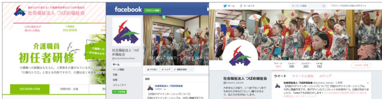
■ 研修ホームページ