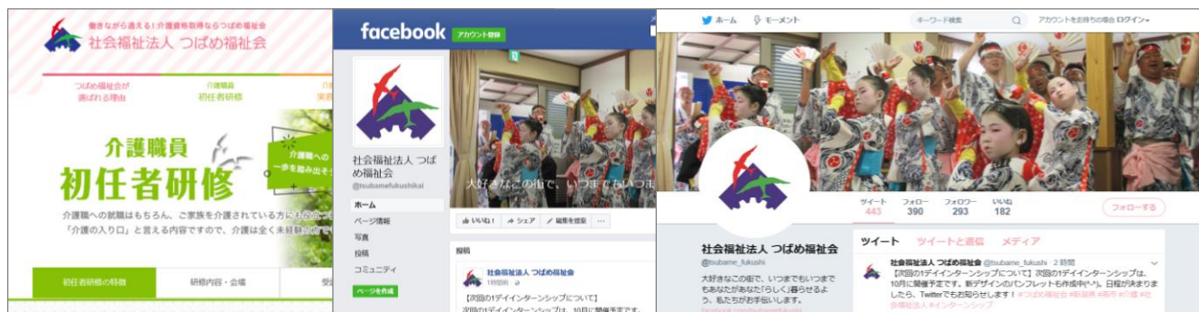
■ 研修ホームページ

～ 研修ホームページ公開！ facebookページ、Twitter 更新中！ ～ 施設の様子や研修情報、採用情報なども発信しています。